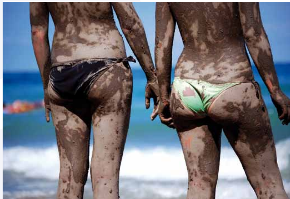
foto: Baño de lodo en Formentera